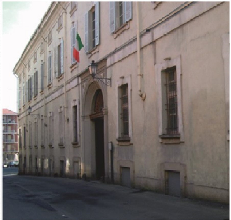
Palazzo De Cardenas del Seicento