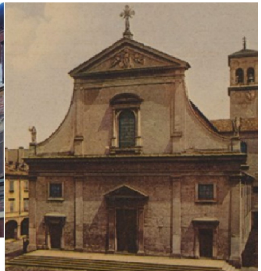
Costruzioni del Seicento a Valenza